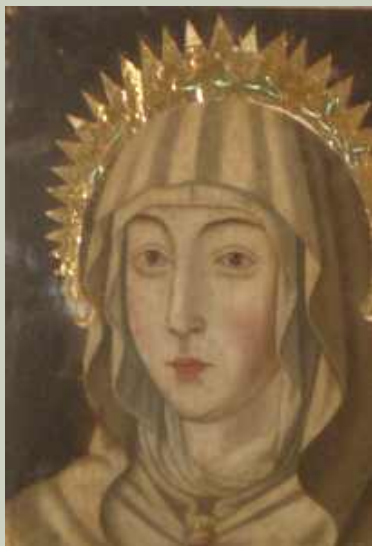
Imagen de la Virgen de la “O”, la cual es motivo de romerías continuas por la fe que le profesan.