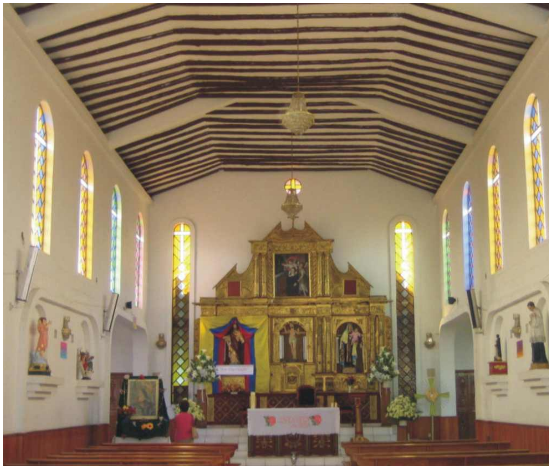
Altar de la Iglesia de Santa Rita de Casia.