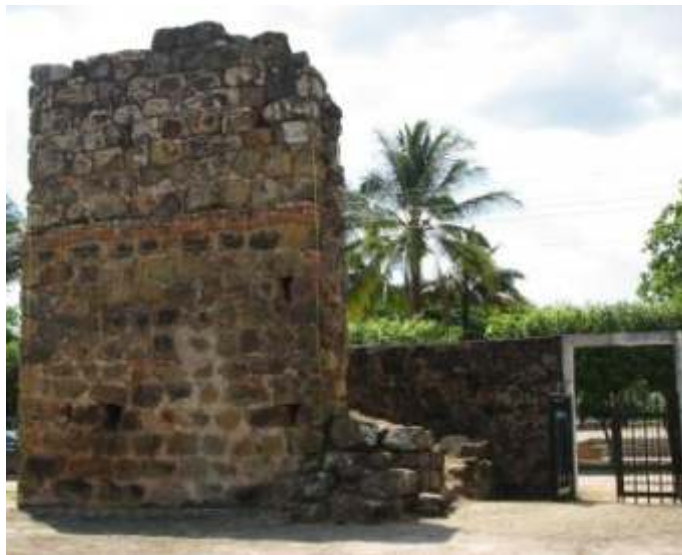
Vestigios de las murallas de Pore.

Dos circunstancias facilitaron la llegada del Ejército Libertador a la población de Pore; la primera, que el padre dominico Fray Mariño, partidario de la causa republicana, apoyaba grupos de resistencia en la zona; y la segunda, que bajo información errónea el General Barreiro, destacó tropas entre el 4 y el 15 de abril entre Morcote, Laguna y Pore, para perseguir al Ejército Bolivariano. Esta situación causó un desgaste en sus tropas, en razón a que ellos se enfrentaron al hambre, a las condiciones climáticas y a la deserción. Barreiro enfermó de paludismo. Cuando el Ejército Libertador llegó a Pore el 22 de junio, para iniciar el ascenso a la cordillera, este lugar se encontraba despejado de la presencia del enemigo.