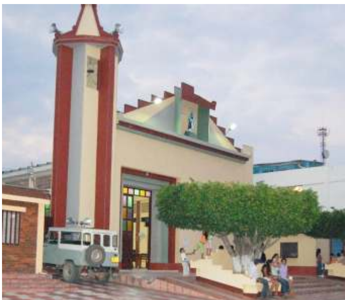
Iglesia de San José