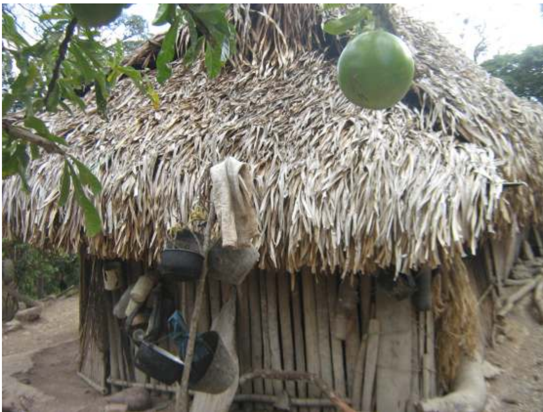
Vivienda rural de Morcote.