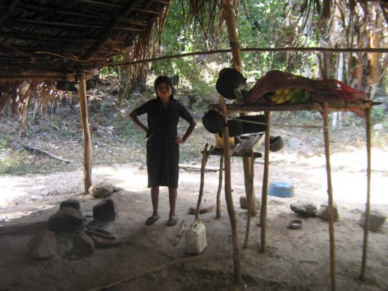
Vida cotidiana en Morcote.