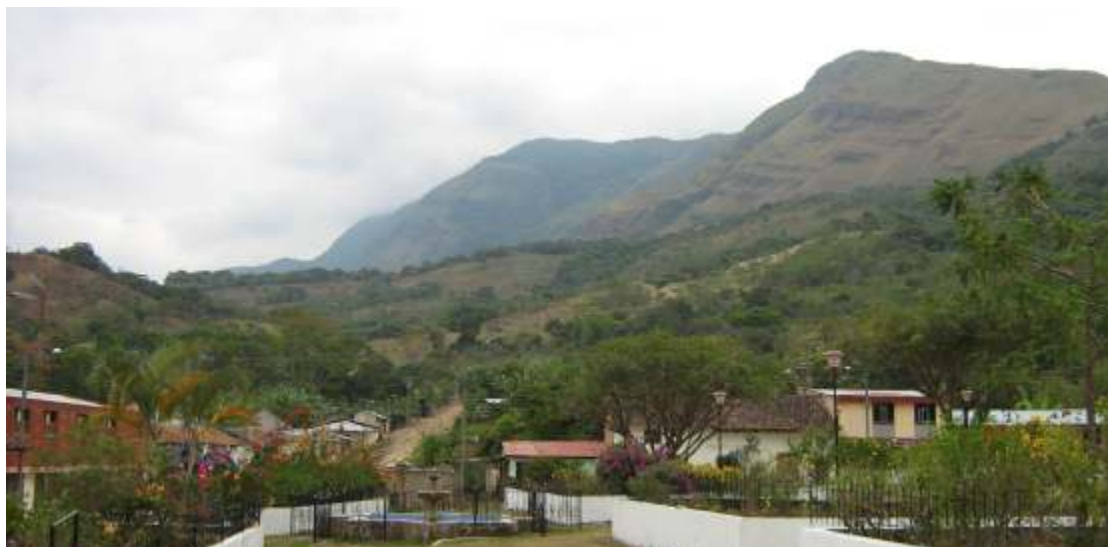
Parque Principal del Municipio

Trincherón de Paya, construcción de piedra hecha por los indios Támara para los españoles.