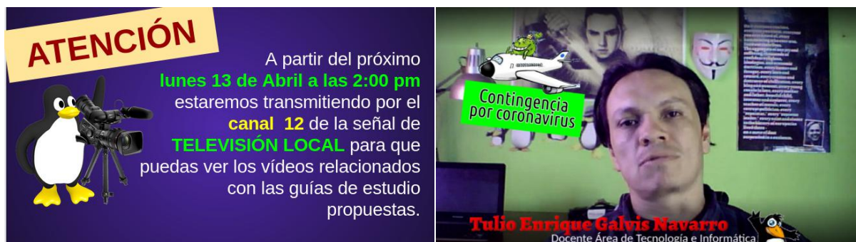
Muestra en página web publicitando la transmisión del programa de televisión en el canal 12 local

Esta estrategia inicia con la descarga de los vídeos recomendados en las guías elaboradas por los docentes, a partir de los cuales se elabora un vídeo presentado por el docente de Tecnología. Previamente se ha organizado un listado a manera de guión, el cual contiene el orden de los contenidos visuales a presentar. El resto del proceso tiene que ver con la edición de vídeo en pc, para lo cual también se han utilizado herramientas informáticas libres tales como Inkscape, Gimp y Openshot. Esta estrategia además de innovadora en la comunidad se sustenta en que la cantidad de contenidos es alta (y ello implicaría una gran cantidad de datos de navegación en la plataforma Youtube), además la señal de televisión cubre al 80% de la población objeto. Esta estrategia debe complementarse con las guías impresas o digitales, ya que estos vídeos son recursos de apoyo (al final de este documento se encuentra el listado de vídeos).